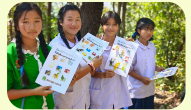
学生同士が主体となって挑む！ 環境教育プログラムの企画・実践