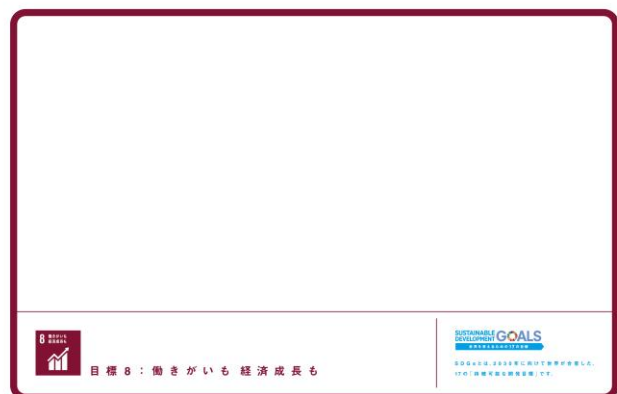
(写真：“目標 8 働きがいも 経済成長も”に関する張り紙(上)とフリーフォーマット版(下))