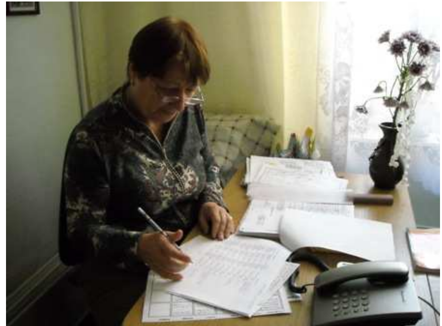
「チェルノブイリの犠牲者の子どもたち」プログラム