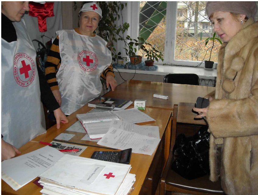
赤十字からの医薬品を配分